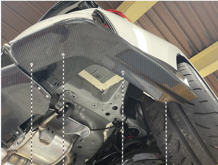
純正タッピングを再利用

お問合わせ 製品についてのお問合せ及び、ご相談につきましては、下記までご連絡願います。