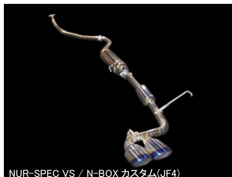
NÜR-SPEC VS / N-BOX カスタム(JF4)