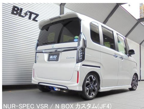
NÜR-SPEC VSR / N-BOX カスタム(JF4)