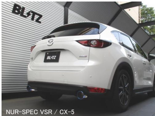
NUR-SPEC VSR / CX-5