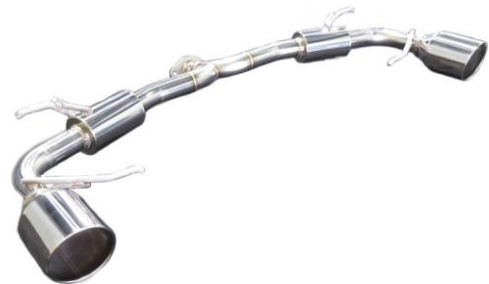
NUR-SPEC VS / CX-5