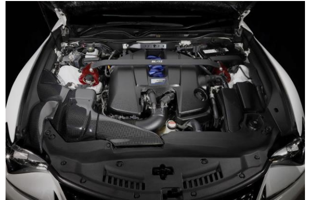
製品装着画像(全景)