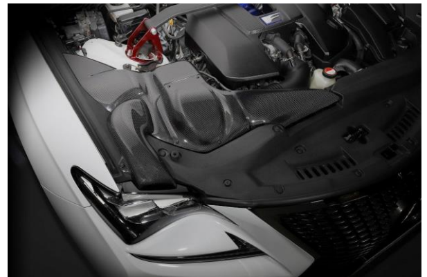
製品装着画像(拡大)

【お問い合わせ】 BLITZ Support Center Phone:0422-60-2277 Fax:0422-60-0066