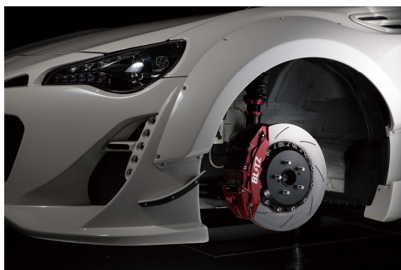
品番 86104 ZN6 86 FRONT KIT