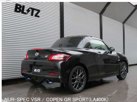
NÜR-SPEC VSR / COPEN GR SPORT(LA400K)