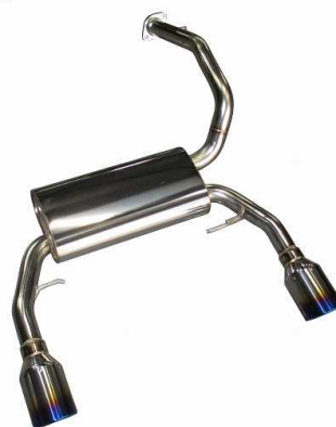
NÜR-SPEC VSR / COPEN GR SPORT(LA400K)