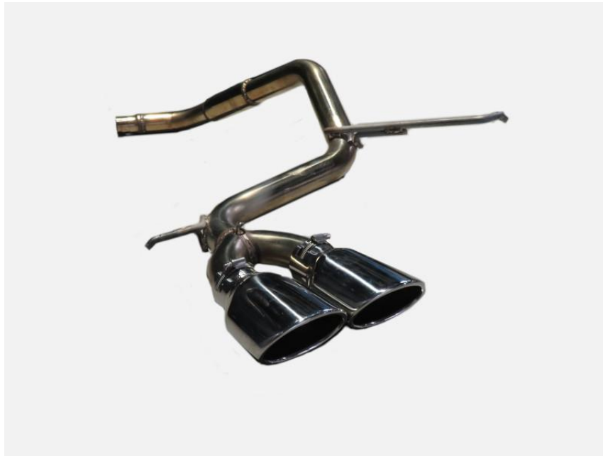
NUR-SPEC CE VS / eK クロススペース