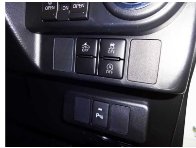
TOYOTA ルーミー アイドリングストップ