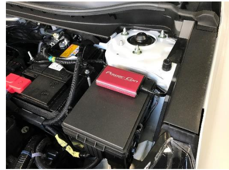
HONDA CR-V 装着例