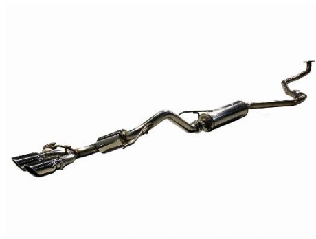
カスタムエディション VS / ステンレスカラーテール