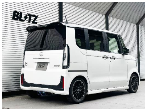
カスタムエディション VSR / チタンカラーテール