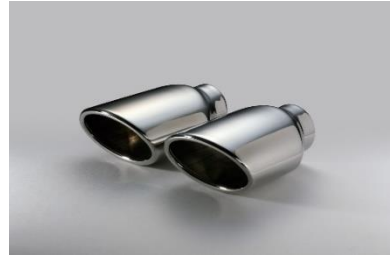
コードNo.62207 ステンレステール (VS)