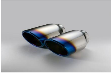
コードNo.62206 チタンカーステンレステール (VSR)