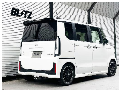
カスタムエディション VS / ステンレスカラーテール