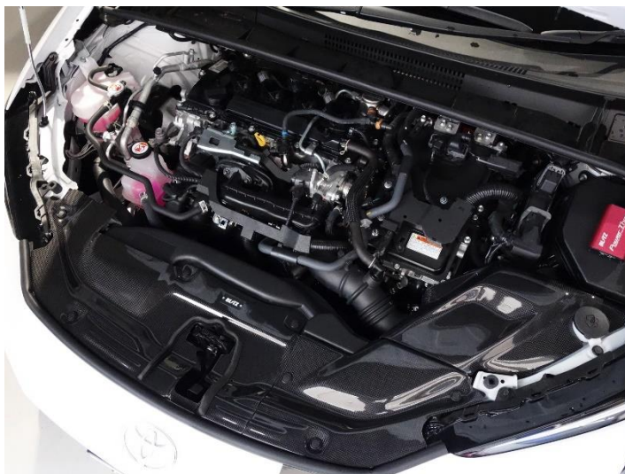
TOYOTA PRIUS (MXWH65)装着写真

CARBON INTAKE SYSTEMに関する詳しい情報は こちらをクリックしてください。