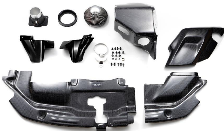
TOYOTA PRIUS (MXWH60/MXWH65)用 CARBON INTAKE SYSTEM製品写真