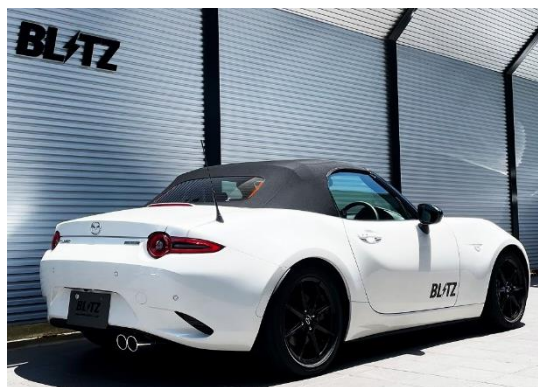
ニルスペック VS / ステンレスカラーテール