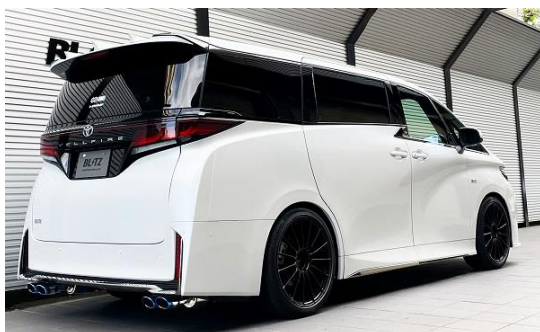
チタンカラーテール装着車