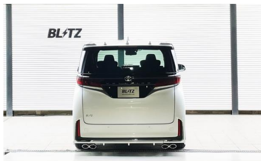
ステンレスカラーテール装着車 ※BLITZエアロ装着車