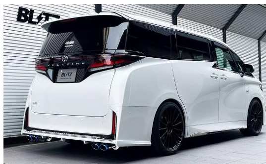
チタンカラーテール装着車 ※BLITZエアロ装着車