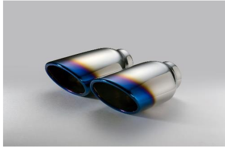
コードNo.62206 チタンカラーステンレステール (VSR)