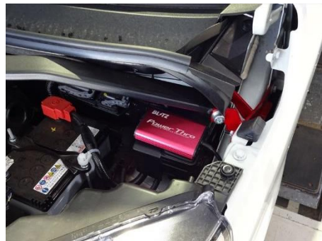
HONDA N-BOX 装着例