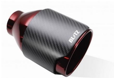
品番:62203 カーボンレッドテール（CR）