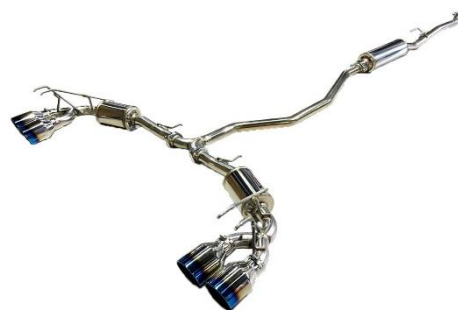
カスタムエディション VSR / チタンカラーテール