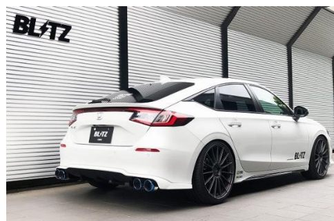
カスタムエディション VSR / チタンカラーテール