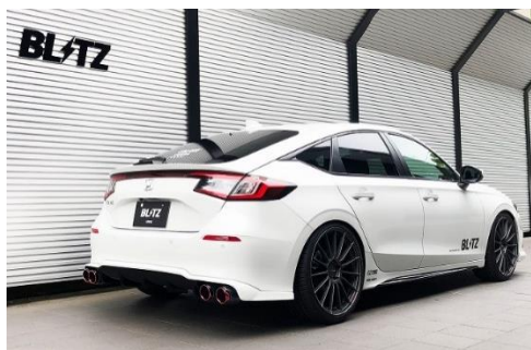
カスタムエディション CR / カーボンレッドテール