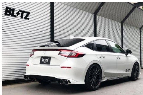
カスタムエディション VS / ステンレスカラーテール