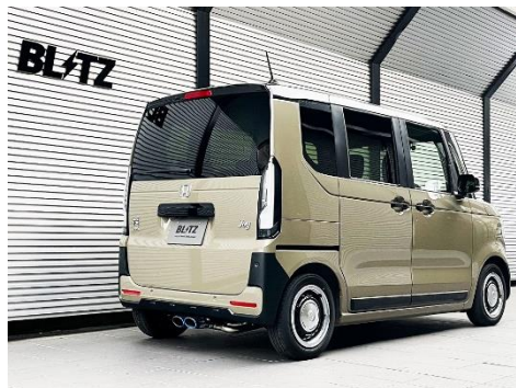
ニルスベック VSR / チタンカラーテール