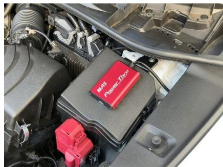
LEXUS LBX MORIZO RR 装着例