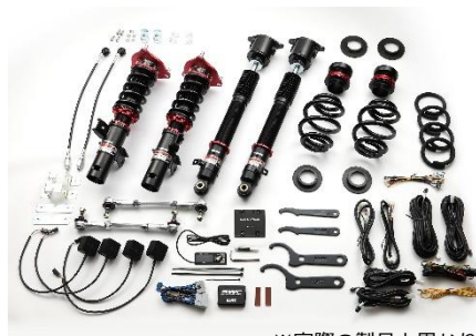
※実際の製品と異なります