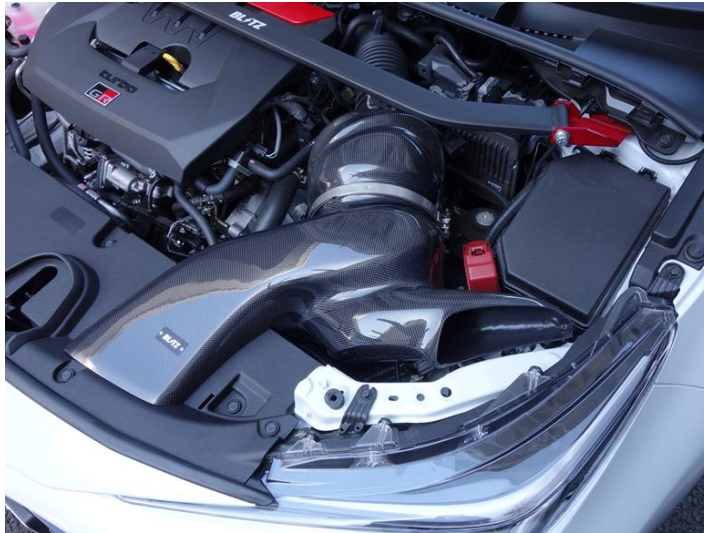
TOYOTA GR COROLLA (GZEA14H)装着写真

CARBON INTAKE SYSTEMに関する詳しい情報は こちらをクリックしてください。