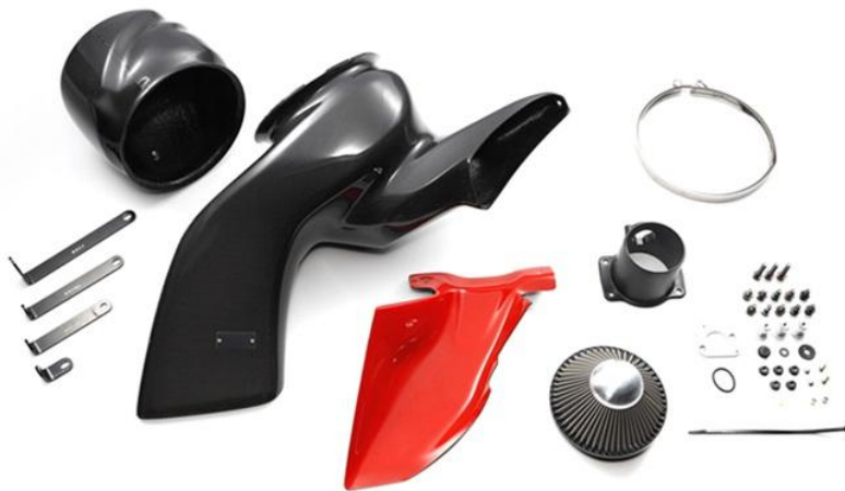
TOYOTA GR COROLLA (GZEA14H) CARBON INTAKE SYSTEM製品写真